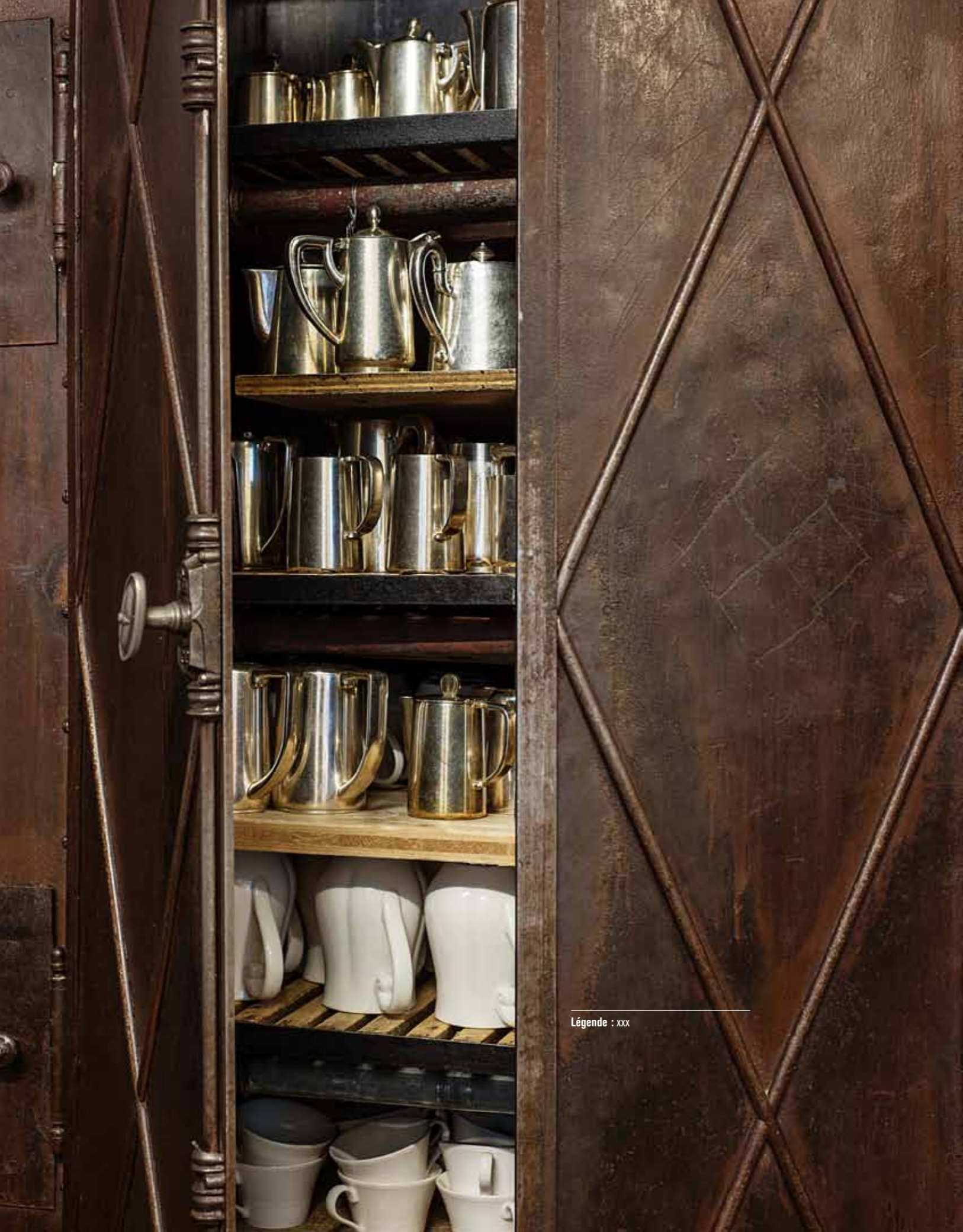
Légende : xxx